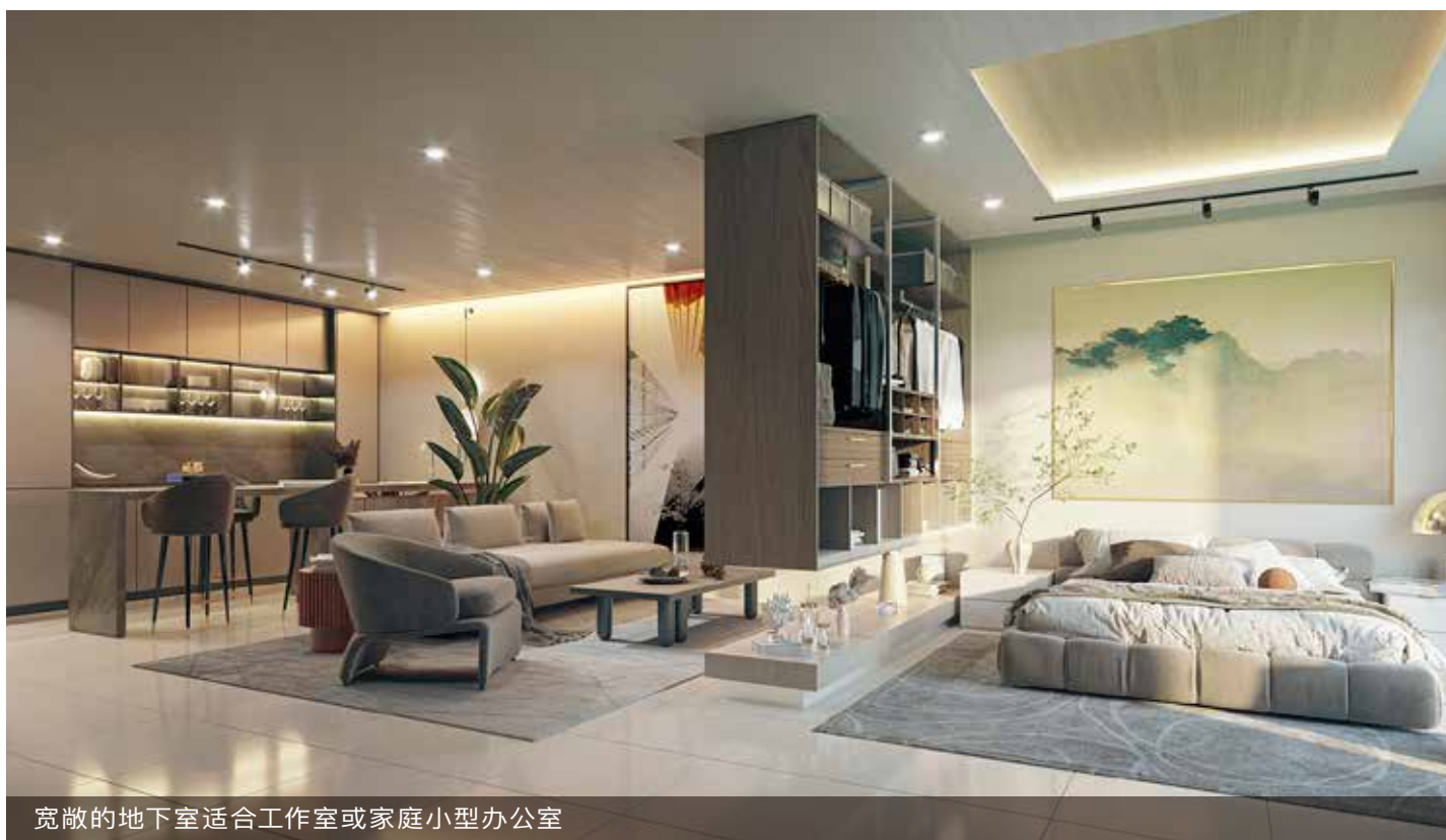
宽敞的地下室适合工作室或家庭小型办公室