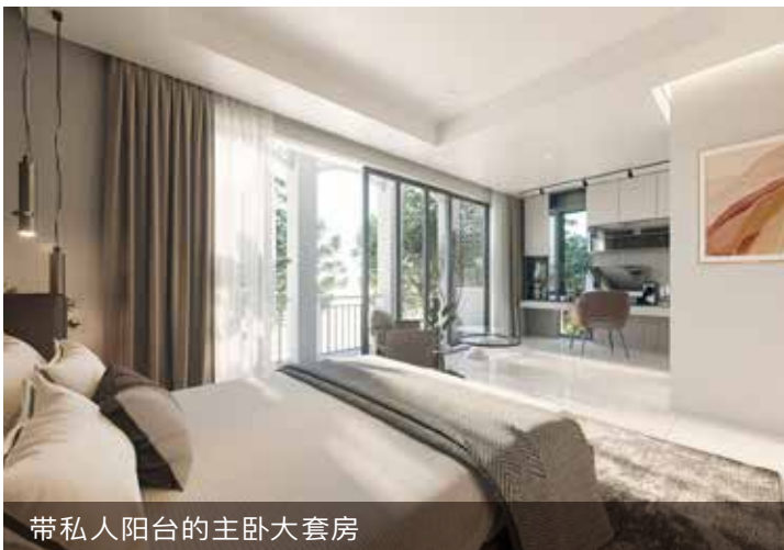
带私人阳台的主卧大套房