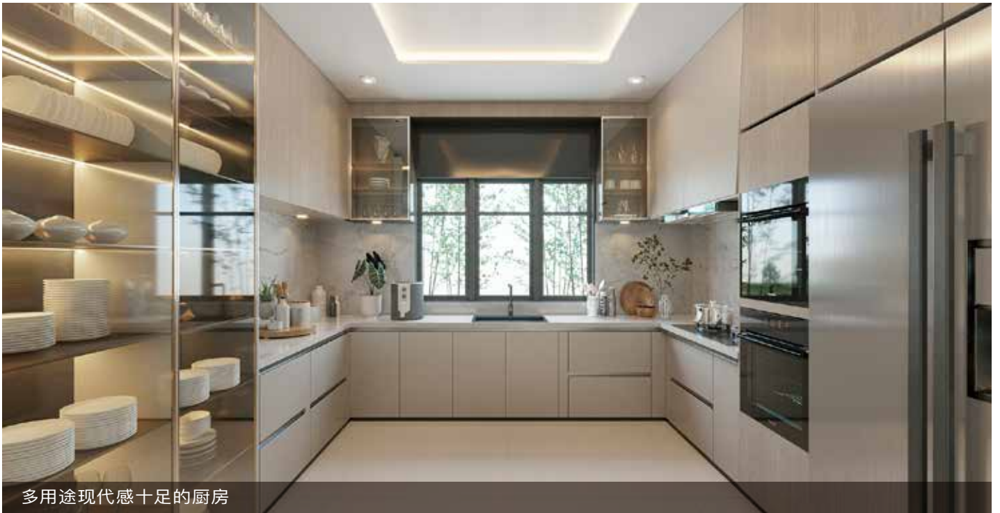
多用途现代感十足的厨房