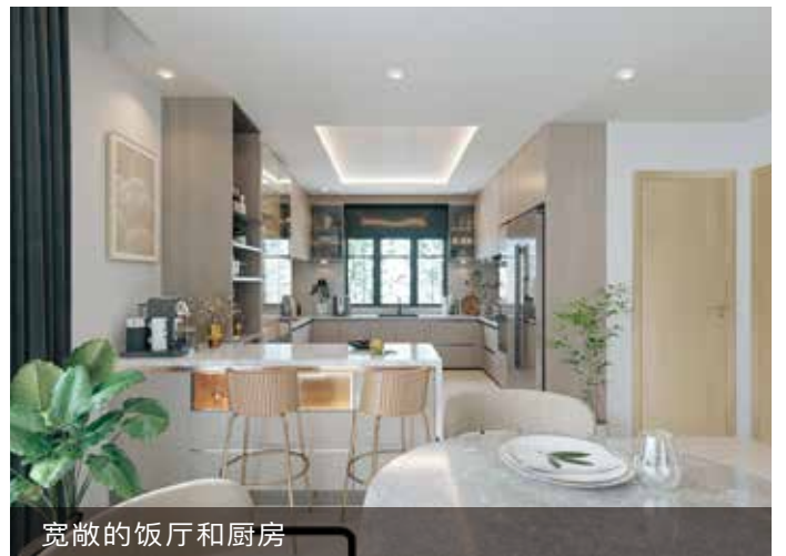
宽敞的饭厅和厨房