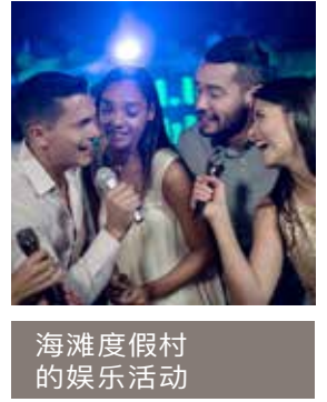
海滩度假村的娱乐活动

槟城在2021年被《国际生活》杂志评为世界第三最适合退休的岛屿。这里有繁华的餐饮场所、丰富的文化遗产和美丽的海岸景色。