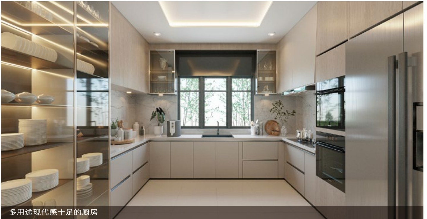
多用途现代感十足的厨房