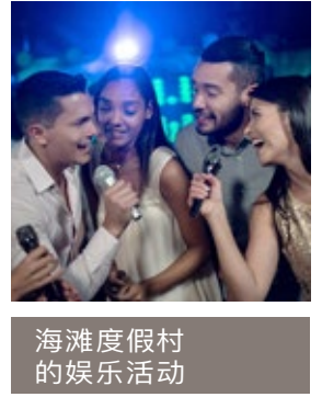
海滩度假村的娱乐活动

槟城在2021年被《国际生活》杂志评为世界第三最适合退休的岛屿。这里有繁华的餐饮场所、丰富的文化遗产和美丽的海岸景色。