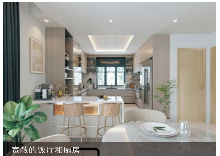
宽敞的饭厅和厨房