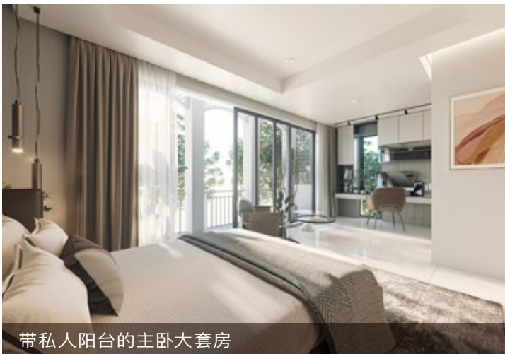
带私人阳台的主卧大套房