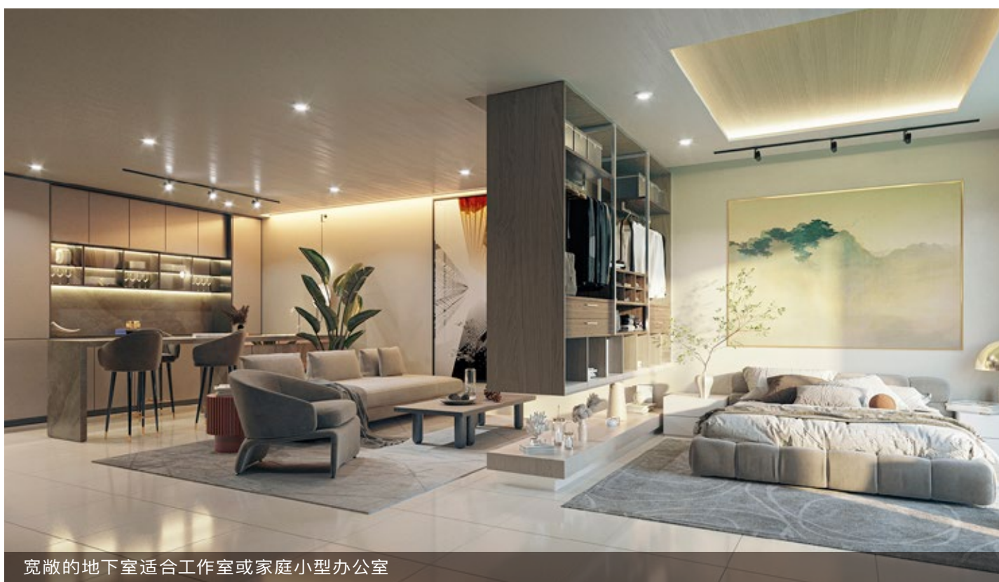
宽敞的地下室适合工作室或家庭小型办公室